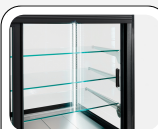
Ψυχόμενα γυαλίνα ράφια